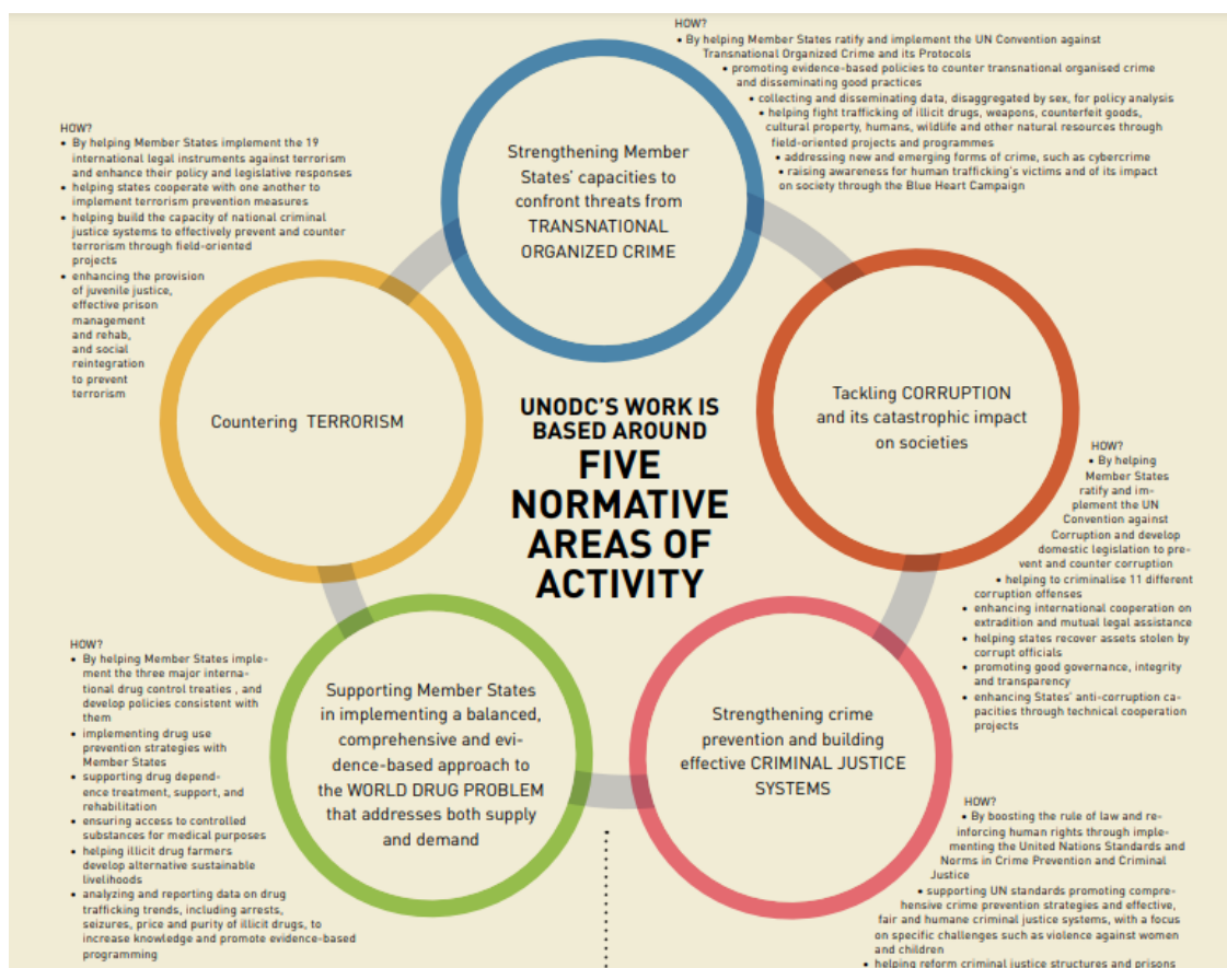
Рис. №3. Пять направлений деятельности УНП.